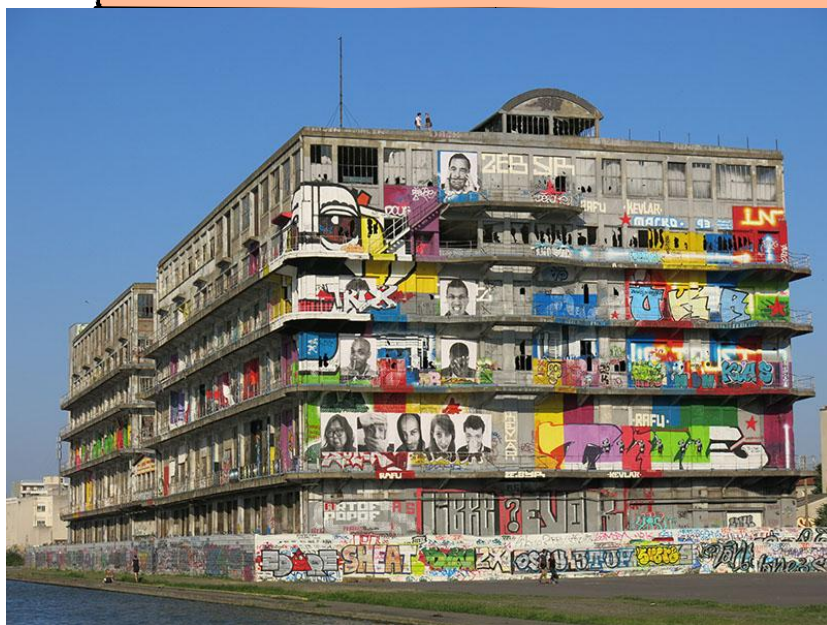
JR. Inside Out- l'Ourcq mon amour , Pantin