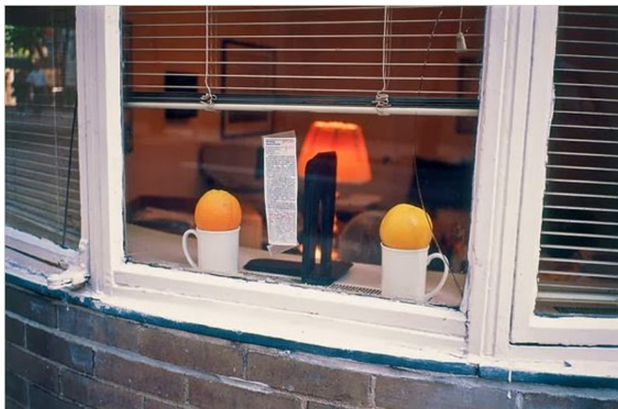
OROZCO Gabriel (né en 1962), Home Run , 1993